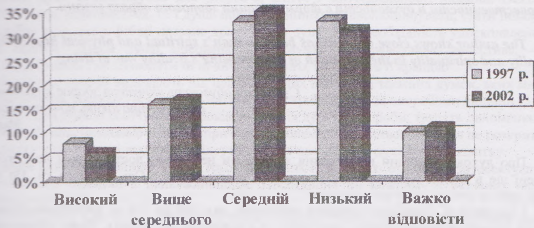
Рис. 4. Рівень інформованості населення Львівщини про хід реформування власності [2, 6].

Крім того, 69% респондентів вважають, що процес приватизації в Україні відбувається справедливо, а найбільшу довіру при її проведенні викликає ФДМУ – 30%, натомість, як центри ефективно приватизації – 4%; 43% респондентів загалом нікому не довіряють у здійсненні приватизаційних процесів.