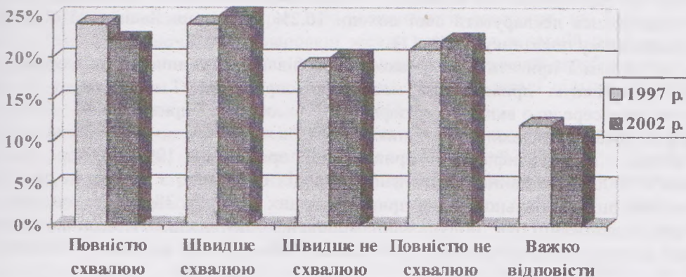
Рис. 3. Ставлення до приватизації великих підприємств [2, 6].

Перша група — це ті, хто сприймає ідею великої приватизації і тих, хто її відкидає. Такий різнобій думок, з огляду на економічну ситуацію кризового типу, що охопила більшість підприємств, колишніх «промислових гігантів». Вона знайшла пряме відображення на працівниках, які в значній мірі не мають достатніх засобів для проживання у вигляді заробітної плати, але й поповнили ряди «висококваліфікованих» безробітних. Вузька спеціалізація людей, інертність, нездатність мобілізувати внутрішні ресурси та орієнтації в складних умовах перехідної економіки, спричинила психологічний злам, а відповідно — втрату життєвих цілей.