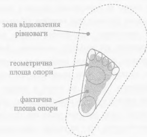
Рис. 3.2. Геометрична, фактична площа опори гімнастики і зона відновлення рівноваги.

По-друге – це наявність так званої зони відновлення рівноваги , невластивої неживим тілам (див. рис.3.2):