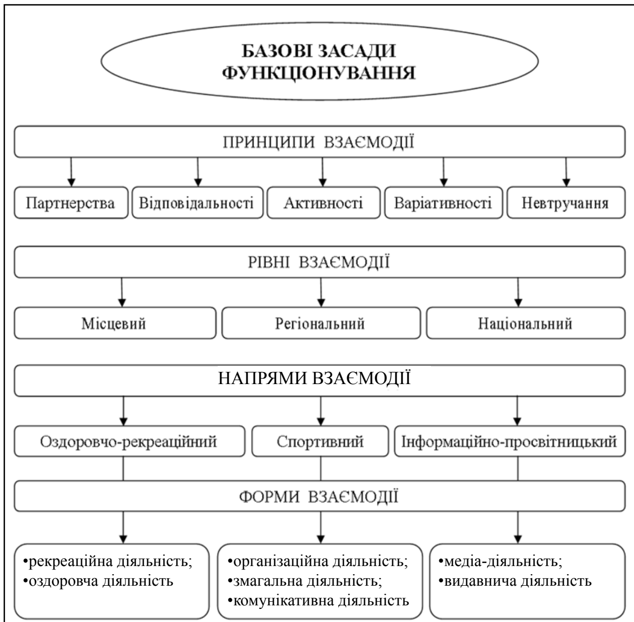
Рис. 1. Теоретична модель взаємодії християнських спортивних організацій з державними і громадськими органами управління спортом в Україні. Рівень А: “Базові засади функціонування”

Передбачається, що успішна взаємодія є можливою при реалізації будь-якого з цих варіантів, однак третій, як найбільш повний, вважаємо оптимальним механізмом реалізації цієї моделі в Україні.