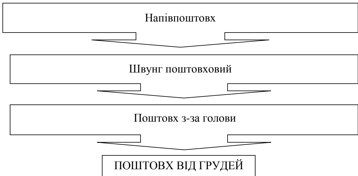
Рис.3. Алгоритм навчання техніки поштовху від грудей.

Напівпоштовх. Спортсмен робить попередній напівприсід, опускаючи тулуб вниз із згинанням у кульшових та колінних суглобах. При цьому штанга утримується на грудях. Спортсмен робить плавний напівприсід, а потім акцентоване виштовхування штанги із виходом на пальці ступні строго вверх до рівня верхівки голови без виконання безопорної фази та підсиду під штангу. Руки супроводжують штангу, контролюючи напрям руху – вверх.