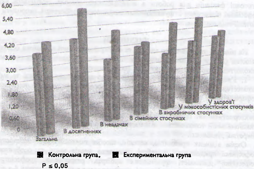
Рис. 2. Показники методики «Рівень суб'єктивного контролю» після психокорекції

Істотні зміни наступили у проявах локусу-контролю. Результати порівняння вираженості інтернатальності в контрольній та експериментальній групах наведені на рисунку 2.