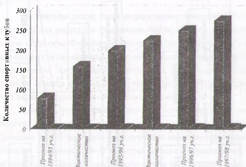
Рис. 2 Динамика количества спортивных клубов общеобразовательных школ Израиля

щеобразовательных школ. Так, при прогнозе создания в 1994 - 1995 гг. 80 спортивных клубов общеобразовательных школ, фактически было создано 159. В 1995 - 96 г. их количество возросло до 225 (рис. 2). Процесс создания школьных спортивных клубов охватил все районы Израиля, за исключением школ крайне религиозных направлений.