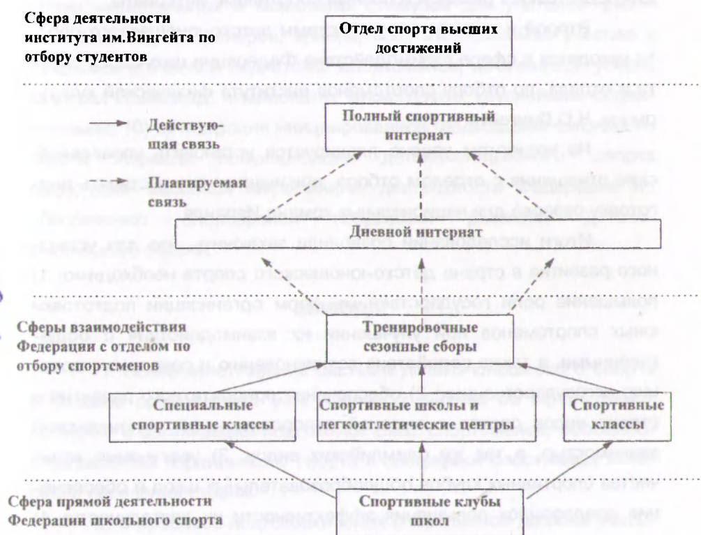
Рис.3 Организационная структура детско-юношеского спорта в Израиле.

Создание Федерации школьного спорта способствовало существенному совершенствованию системы детско-юношеского спорта в Израиле (рис. 3).