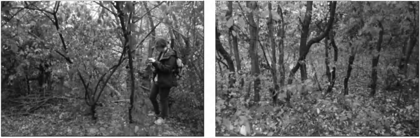
Рис. 1. Ділянки парку вибрані до початку проектування