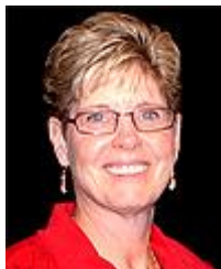
Рис. 7. Дональда Кей Аммонс

Дональда Кей Аммонс (рис. 7) стала сьомим президентом МКСТГ (2003-2009), американський педагог, професор Галлодетського університету у Вашингтоні. Вона була призначена виконуючим обов'язки президента після смерті Джона М. Ловетта в 2003 році. На конгресі в 2005 році вона була офіційно обрана на пост президента МКСТГ.