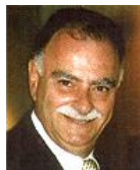
Рис. 6. Джон М. Ловетт

Джон М. Ловетт (рис. 6) - шостий президент МКСГ (1995-2003), представник австралійського уряду, що поклав початок розвитку спорту глухих в Австралії