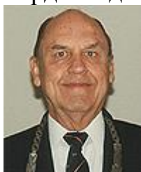
Рис. 5. Джеральд М. Джордан

Джеральд М. Джордан (рис. 5) - п'ятий президент МКСГ (1971-1995), американський видавець, педагог Галлодетського університету у Вашингтоні, округ Колумбія. Джеральд М. Джордан є першим Президентом МКСГ, який отримав Олімпійський орден від МОК в 1995 році