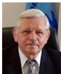
Рис. 9. В.Н. Рухледєв

Нині дев'ятим президентом МКСТГ (з 2013 р.) є В.Н. Рухледєв (рис. 9), шестиразовий чемпіон Дефлімпійських ігор з боротьби, один з десяти топ-спортсменів, володар «премії століття», що вручається спортсменам-дефлімпійцям, видатний громадський і політичний діяч національного та міжнародного рівня, який тривалий час очолював спортивні організації глухих Російської Федерації.