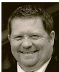
Рис. 8. Крейг А. Кроулі

Крейг А. Кроулі (рис. 8) - восьмий президент (2009-2013) МКСТГ, представник Великої Британії, який має великий досвід громадської діяльності. Крейг раніше сам був спортсменом і тренером, засновник і перший президент Союзу спорту глухих Великої Британії.