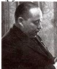
Рис.4. П'єр Бернхард

П'єр Бернхард - четвертий президент МКСГ (1961-1971), французький скульптор, учасник Опору під час Другої світової війни, письменник (рис. 4).