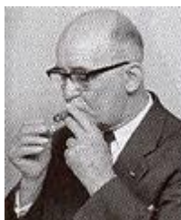
Рис. 3. Дженс Пітер Нельсен

Третім президентом МКСГ був Дженс Пітер Нельсен (1955-1961), представник Данії, який присвятив все своє життя розвитку спорту глухих (рис. 3).