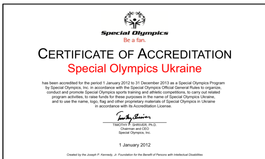
Рис. 12. Сертифікат акредитації ВГОІ «Спеціальна Олімпіада України»

«Акредитаційна ліцензія» – документ, що представляється кожною програмою як частина заявки на нову чи оновлену акредитацію, в разі затвердження Міжнародною організацією Спеціальних Олімпіад є підтвердженням повноважень програми та підставою для видачі сертифікату акредитації (рис.12).