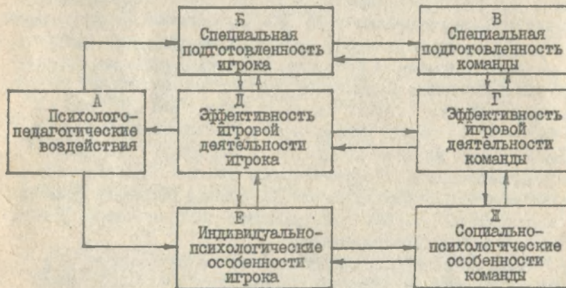
Рис. Схема управления подготовкой спортивной команды с учетом групповых и индивидуально-психологических особенностей

Опрос и обобщение практического опыта тренеров, а также анализ научно-методической литературы свидетельствует о том, что подготовка команд строится по следующей схеме (рис.): А-Б-В-Г-Д-А.