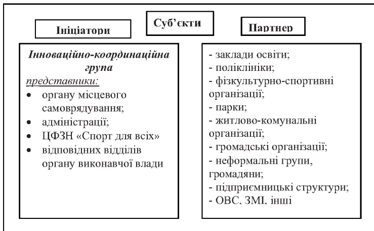
Рис. 2. Суб'єкти взаємодії (стейкхолдери)

Висновки. Пріоритетність організаційної взаємодії, у порівнянні з іншими засобами вирішення існуючих проблем, полягає саме в тому, що таке поєднання зусиль окремих зацікавлених осіб дозволяє суттєво скоротити використання досить обмежених ресурсів, які на сьогодні перебувають в розпорядженні місцевих громад. Синергетичний ефект можна отримати, в першу чергу, за рахунок скорочення трансакційних витрат, раціоналізації використання окремих видів ресурсів, тощо.