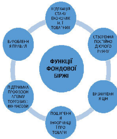
Рис.2. Функції фондової біржі

Отже, узагальнюючи наведене, функції фондової біржі можна показати [2] на рис. 2.