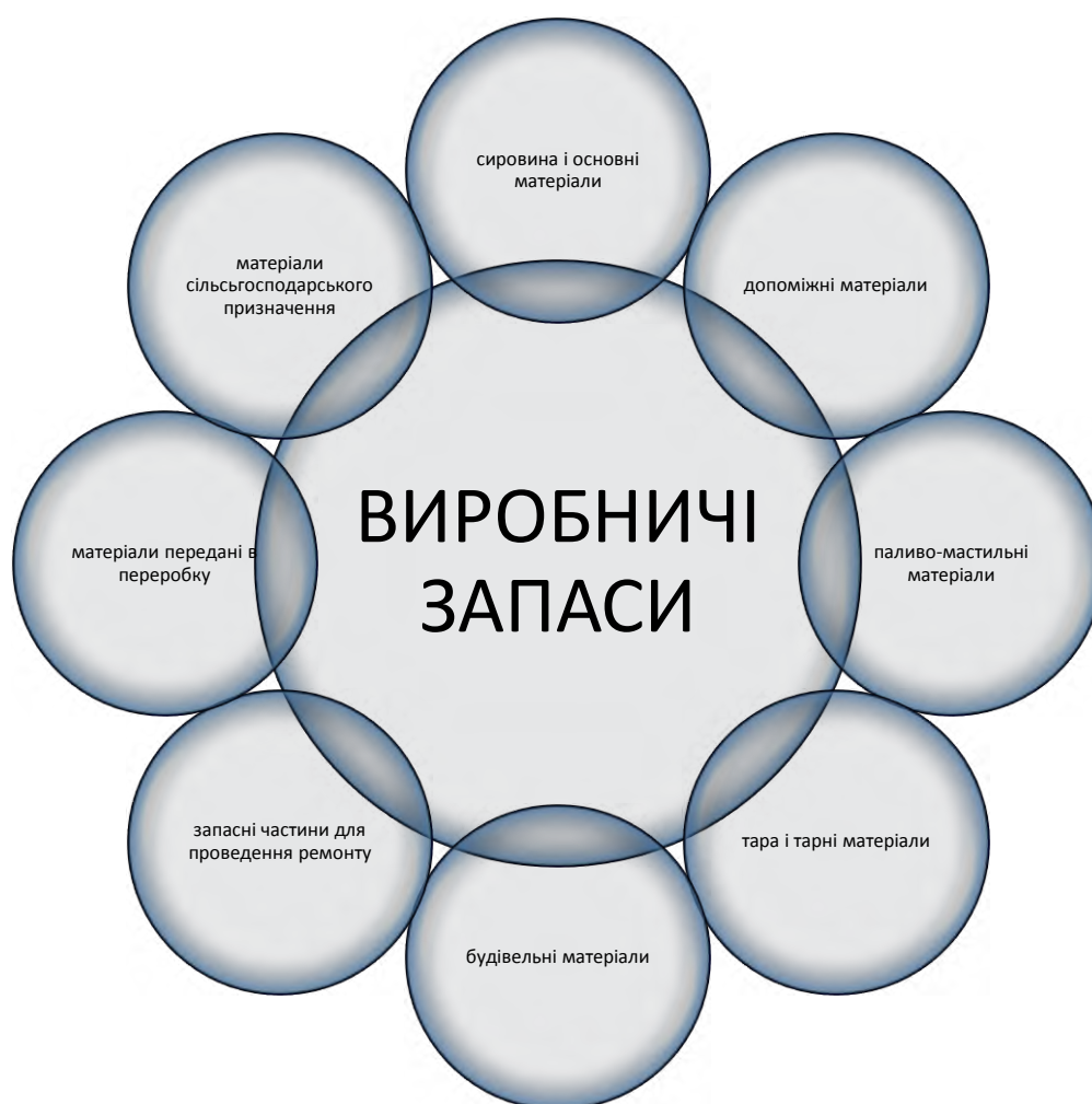
Рис. 3. Виробничі запаси

Класифікація не лише полегшує роботу працівників бухгалтерії, а є необхідною для ефективного контролю за станом залишків запасів на складах підприємства в межах потреб, а також за правильним їх використанням у виробництві.