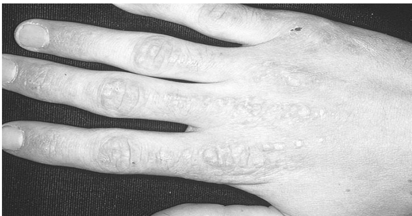
Мал. 3. Симптом Готрона.

Кальцифікати розташовані підшкірно або в сполучній тканині, коло м'язових волокон, в зонах мікротравматизації над ліктювими і колінними суглобами, на згинальних поверхнях пальців і сідницях, розвивається на пізніх стадіях ПМ / ДМ, частіше при ювенільному ДМ.