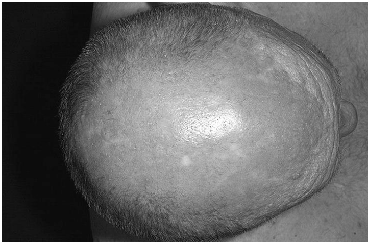
Мал.1 Еритема шкіри при ДМ.

Початок захворювання може бути гострим (лихоманка до 38-39 ° С, Еритема шкіри (Мал. 1) і болі у м'язах), але частіше спостерігається поступовий, іноді непомітний початок хвороби.