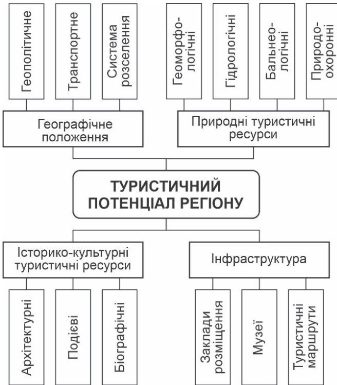
Рис. 1. Структура туристичного потенціалу регіону*