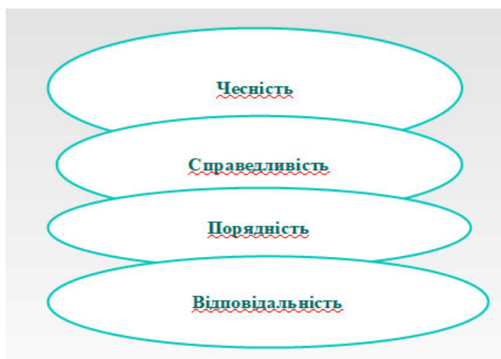
Рис. 1.1. Взаємозв'язок морально-етичних категорій

Чесність зазвичай розглядали як елемент соціальної справедливості, проте в сучасній думці ця чеснота все більш витісняється жадібним матеріалізмом, крайнощами військової пропаганди, брехливими софізмами ситуативної етики та міркуваннями політичної вигоди. Чесність і чесноти тісно пов'язані між собою (рис.1.1.).