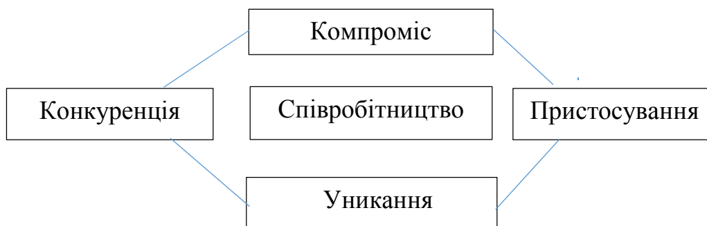
Рис. Стратегії поведінки в конфлікті

На конфліктні ситуації люди здатні реагувати по-різному, обираючи ту чи іншу стратегію поведінки в конфлікті.