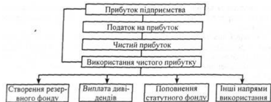
Рис. 7.5. Структурна схема розподілу і використання прибутку

міжнародних стандартів можна виразити в такий спосіб (рис. 7.5.).