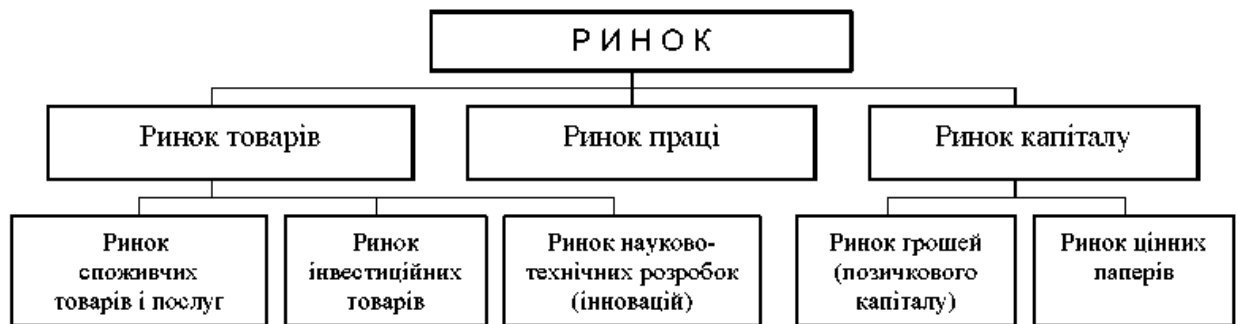
Рис. 8.2. Загальна структура ринку

Сучасний, розвинений ринок характеризується складною структурою, або системою, що складається з багатьох видів (сегментів) ринку. У найбільш загальному вигляді структура ринку за об'єктами купівлі-продажу представлена тріадою основних ринків: ринком товарів, ринком праці та ринком капіталу (рис. 8.2).