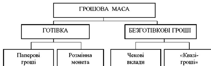
Рис. 7.1. Структура грошової маси

Грошова маса характеризує пропозицію грошей в економіці і має доволі складну структуру (рис. 7.1).