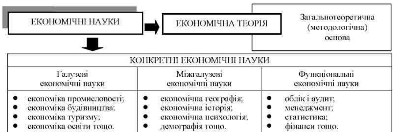
Рис. 1.1. Система економічних наук

Система конкретних (прикладних) економічних наук представлена на рис. 1.1.