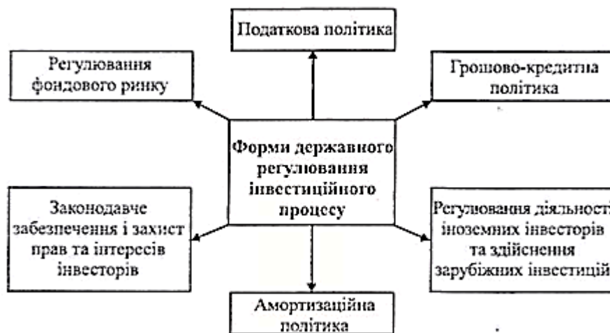
Рис. Форми державного регулювання інвестиційного процесу