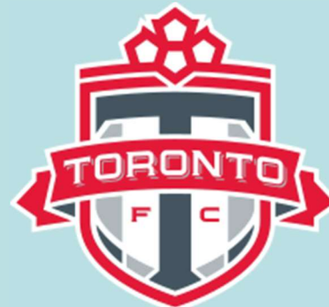
Toronto FC (MLS)