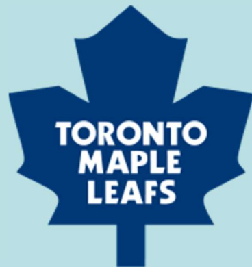
Toronto Maple Leafs (NHL)