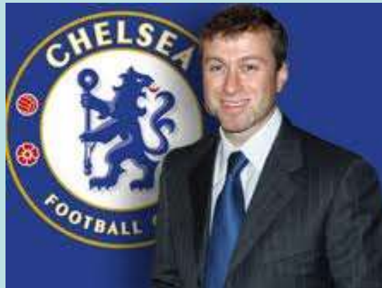
Роман Абрамович – рос. мільярдер, власник англійського футбольного клубу Chelsea (з 2003 р.)