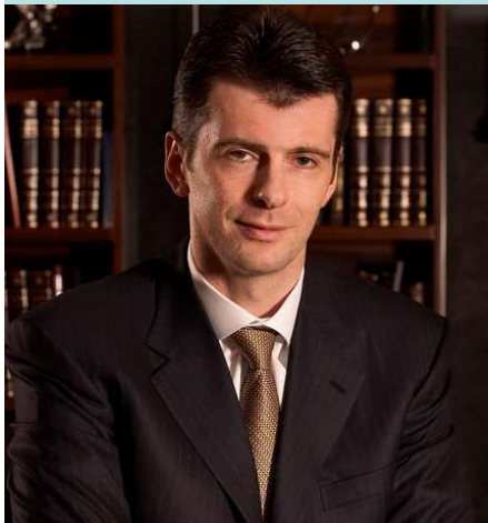
Михайло Прохоров рос. мільярдер, власник американського баскетбольного клубу New Jersey Nets (з 2010 р.)