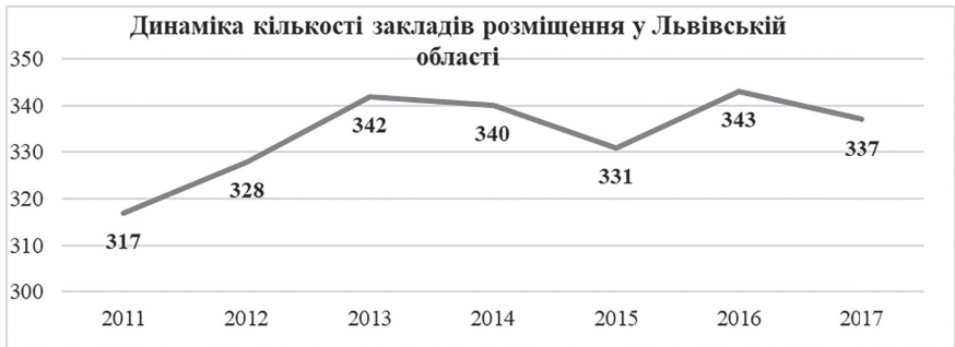
Рис. 2. Динаміка кількості закладів розміщення у Львівській області [1]

Також можна проаналізувати показники із закладів розміщення за районами Львівської області (рис. 3).