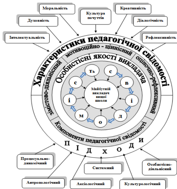
Рис. 1 – Теоретична модель структури педагогічної свідомості майбутнього викладача вищої школи

Отже, на основі дослідження педагогічної свідомості та її структури, була розроблена теоретична модель структури педагогічної свідомості майбутнього викладача вищої школи (рис. 1).