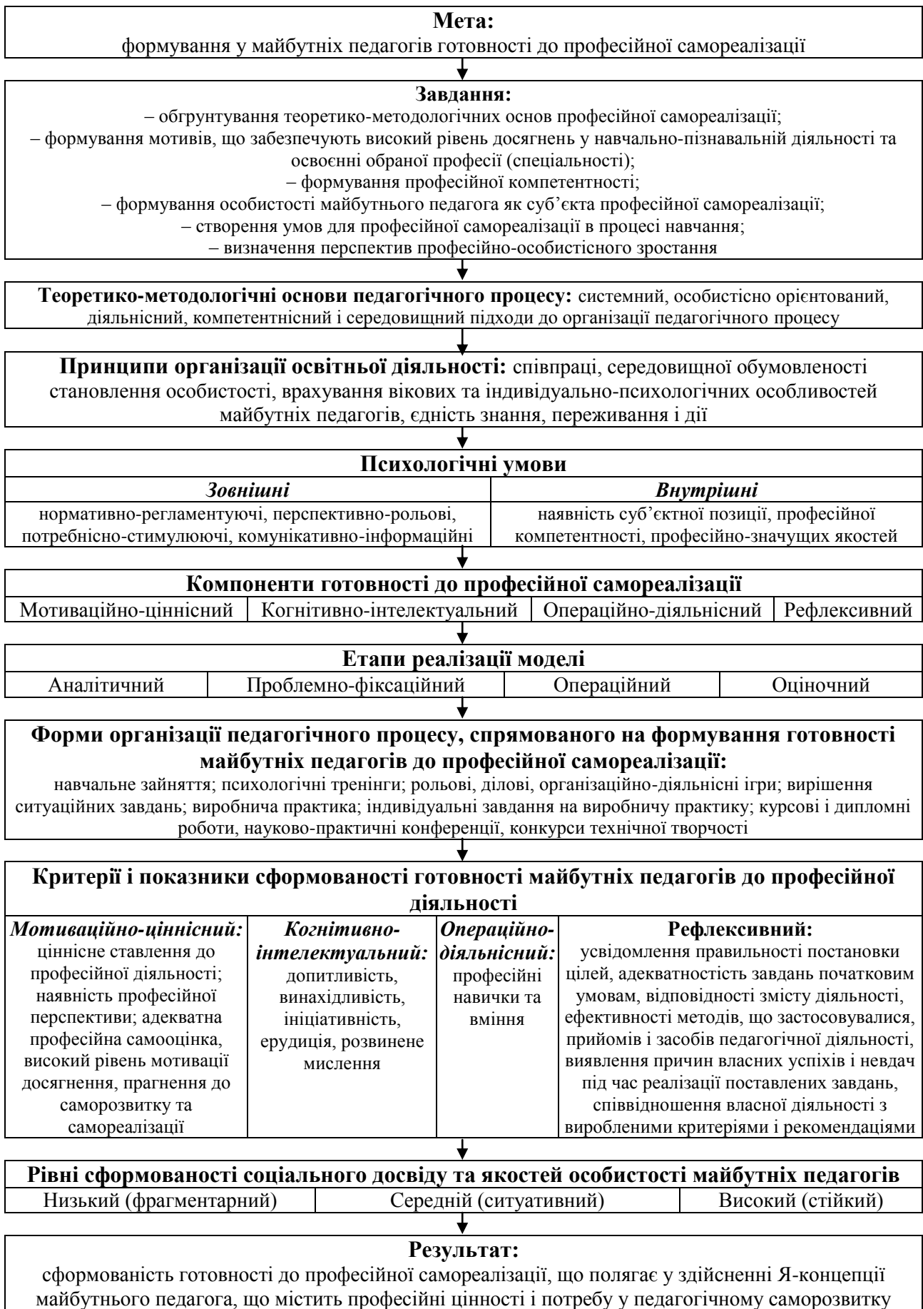
Рисунок 1 – Психолого-педагогічна модель формування готовності майбутніх педагогів до професійної самореалізації