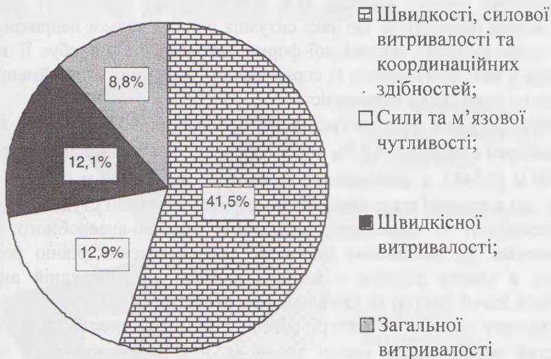
Рис. 1. Внесок факторів у структуру загальної фізичної підготовленості студентів 1-го курсу

Прискорене виконання вправи силової спрямованості дозволяє скоротити час випробування і уникнути впровадження аеробних механізмів енергозабезпечення м'язів, що за даними бігу на 3000 м у даному віці є малоефективними. Однак, різна спрямованість навантажень не дозволяє об'єднати три показника і, на нашу думку, найбільш доцільно буде інтерпретувати даний фактор (рис. 1) як «швидкості, силової витривалості та координаційних здібностей».