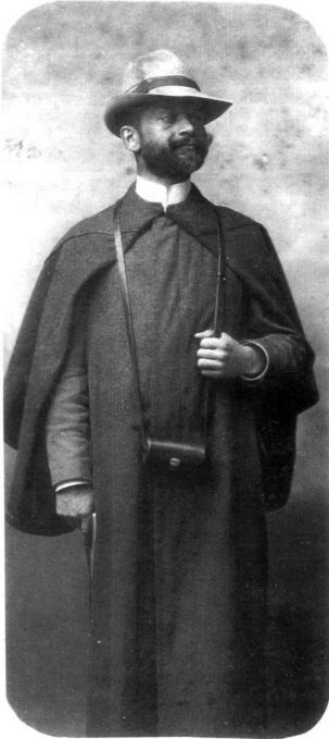
Фотопортрет Івана Боберського – професора Академічної гімназії у Львові. 1912 р.

Іван Боберський (1873, с. Доброгостів – 1947, м. Тржич, Словенія) – видатний український громадський, культурно-просвітній, військовий, державний діяч, педагог, журналіст, організатор, фундатор української тіловиховної і спортової традиції, розробник української спортової та військової термінології, меценат. Про його життєвий та творчий шлях, на жаль, в українській та іноземній історіографії нема ґрунтовних праць. Окремі аспекти біографії Івана Боберського відсутні не тільки в нечисленних розвідках українських дослідників, зокрема Івана Андрухів, Ореста Круковського, Ярослава Малика, Оксани Вацеби, Богдана Трофим'яка та ін., а й у довідкових виданнях. Яскравим прикладом цього є його педагогічна діяльність на посаді учителя цісарсько-королівської гімназії у Дрогобичі упродовж 1900–1901 навчального року. У багатьох довідниках та енциклопедіях, які вийшли в Україні та за кордоном, або не згадують про цей факт у його життєписі або помилково пишуть, що з 1900 р. Іван Боберський працював у Академічній гімназії у Львові 1 . З огляду на таку неточність та численні лакуни підготовлено цю публікацію, у якій висвітлено педагогічну діяльність Івана Боберського дрогобицького періоду. Звернена увага на його викладання німецької мови, проведення уроків гімнастики (руханки), завідування німецькомовною бібліотекою, проведення прогулок (піших мандрівок) Дрогобиччиною.