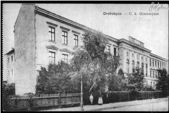
Дрогобицька гімназія, в якій 1900–1901 н. р. працював Іван Боберський. Поштівка поч. ХХ ст.

гімнастику в 1–6-их класах 13 . Зауважимо, що гімнастика (Боберський запропонував на її означення український термін “руханка”) тоді була не обов’язковою (надобов’язковою) дисципліною і проводилася у поза навчальний час. Попри це, Іванові Боберському вдалося зацікавити нею гімназійну молодь.