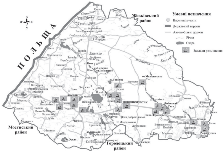
Рис. 3. Картохема аналогічних закладів розміщення Яворівського району: