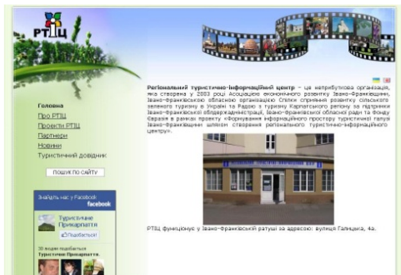
Рис. 1. Інтерфейс сайту “Регіональний туристичний інформаційний центр”

заклади проживання, харчування; транспортну інфраструктуру; культурні події в регіоні (місті, районах – фестивалі, концерти); місця історичного та культурного значення (серед яких музеї, замки, пам'ятки природи та архітектури); об'єкти туристичного значення; туристичні організації та послуги екскурсоводів; туристичні маршрути (рис. 1).