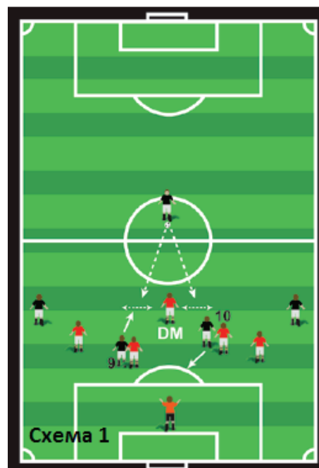
Рис. 2. Схема ефективного розташування і тактичні переміщення в обороні центрального (опорного) півзахисника (англ. «defending midfielder» (DM)) на футбольному полі [28, 31]

5. Деталізований (з використанням стоп-кадру та комп'ютерної графіки) відеоаналіз матчів допоміг встановити, що індивідуальні дії центрального (опорного) півзахисника провідних команд Європи підпорядковуються колективній грі. Проте це жодною мірою не змен-