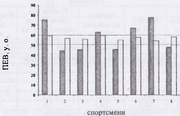
Рис. 1. Зміни індивідуальних показників ( n=8 ) ефективності відновлення (ПЕВ) у процесі тренувальних занять контрольного й експериментального мікроциклу:

Комплекси тренувальних і позатренувальних впливів були розроблені й підібрані таким чином, щоб їх можна було використовувати як протягом 7–10 денного циклу, коли застосовується весь арсенал впливів, так і протягом 3–4 денного, коли дефіцит часу вимагає застосування ізольованих, при цьому найбільш ефективних, впливів, спрямованих на активізацію відновлення, стимуляцію відновних реакцій організму або стимуляцію роботоздатності.