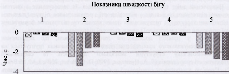
Рис. 2. Відмінності контрольного й експериментального подолання відрізків дистанції 400 метрів (n=8):

Представлені дані свідчать, що експериментальні впливи діють на спеціальну роботоздатність легкоатлетів-бігунів на дистанції 400 метрів.