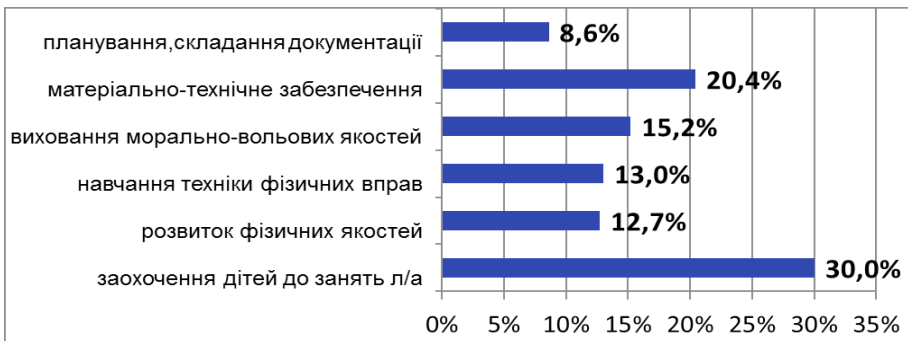
Рис. 2. Найскладніші розділи, на думку тренерів, у їх роботі (%)

Найскладнішим розділом роботи тренерів є заохочення дітей до занять легкою атлетикою (30%), друге за складністю є питання матеріально-технічного забезпечення (20,4%). Цей чинник вирішальним, оскільки без спеціалізованого інвентарю, бігової доріжки реалізація потенціалу суттєво зменшується (рис. 2). Приблизно в однаковому відсотковому співвідношенні в межах 13–15% знаходяться питання, присвячені вихованню морально-вольових якостей, навчання техніки фізичних вправ та розвиток фізичних якостей. На останній сходинці розташувалось планування та складання робочої документації, що становить лише 8,6% опитаних.