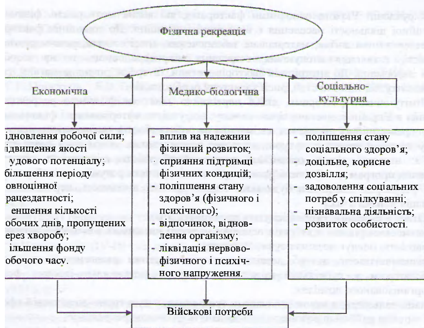
Рис. 2. Суспільні функції фізичної рекреації у перший період Новітнього часу (1917-1945 рр.)

Іншими важливими чинниками, що активізували залучення населення до активного відпочинку є: пропаганда засобами масової інформації факторів здорового способу життя; розробка системи «відпочинок в кредит»; удосконалення розширення дозвіллевих послуг і товарів; систематичне вивчення запитів і ань населення щодо активного відпочинку; покращення інфраструктури ладів активного відпочинку і дозвілля; виробництво товарів спортивно-реакційного і туристичного призначення.