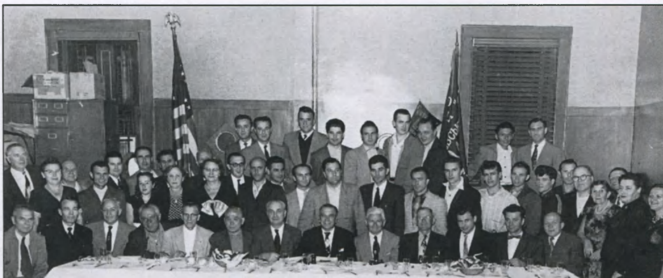
Історичні для Т-ва Річні Загальні Збори, що відбулися 21 вересня 1956 р. Тоді саме до Проводу Т-ва увійшло значне число осіб з новоприбулої 3-ої хвилі імміграції.

The historical Annual Meeting of September 21, 1956, at which a significant number of new immigrants joined "Ch. Sitch" and the ranks of its management.