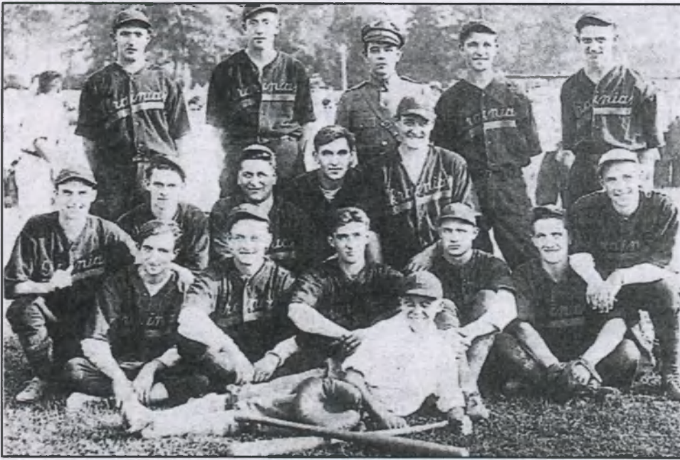
Бейсболова дружина «Ч. Січі» в сезоні 1931 р.