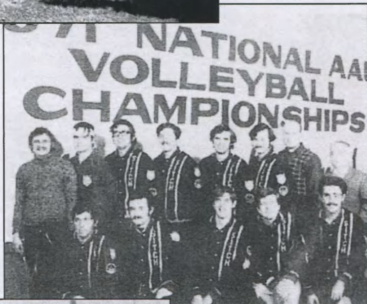
The "Sitch" men's volleyball team at the National AAU championship in Cleveland. May 1971.