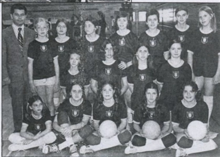
"Sitch" two junior volleyball teams before competing in a tournament on May 19, 1973 at Columbia High School, Maplewood, NJ.