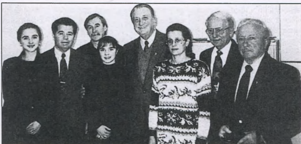
Зустріч з олімпійською чемпіонкою гімнастики – Л. Подкопаєвою (друга справа) після Олімпіади в Атланті 1996 р. A meeting with the Olympic gymnastics champion L. Podkopaeva (second from right), after the 1996 Atlanta Olympiad.