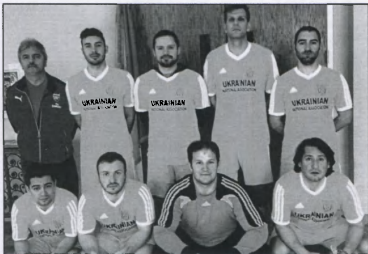
Сімка дружини «Чорноморської Січі», яка здобула вдруге за порядком перше місце у меморіальному січовому турнірі ім. С. Гованського в Йонкерсі, НЙ.