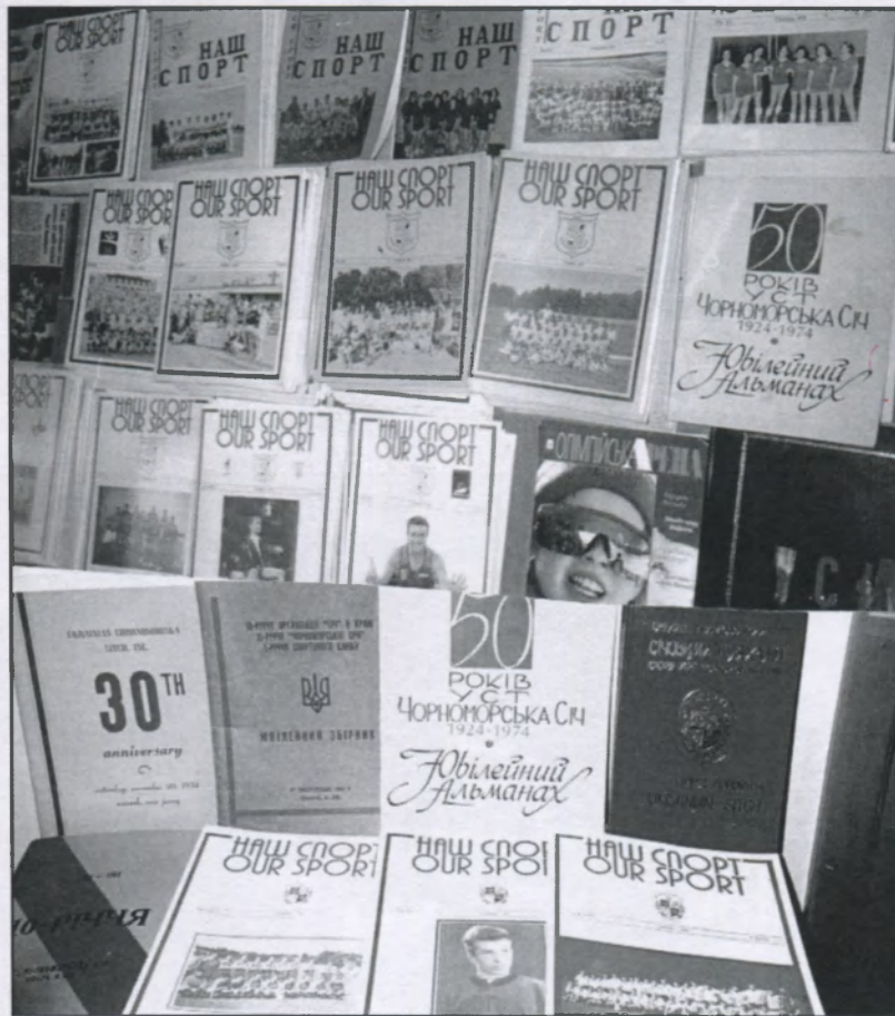
Публікації, які на протязі років видало УСВТ «Чорноморська Січ».