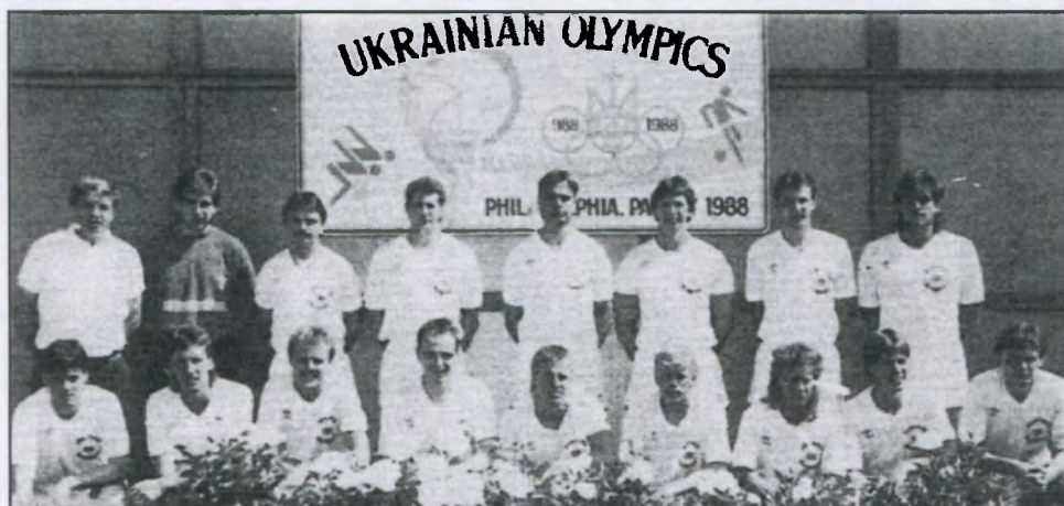
1-ша дружина копаного м'яча здобула звання чемпіона і золоту медаль Української Спортової Олімпіади у 1988 р. у Філядельфії.

The historical Annual Meeting of September 21, 1956, at which a significant number of new immigrants joined "Ch. Sitch" and the ranks of its management.