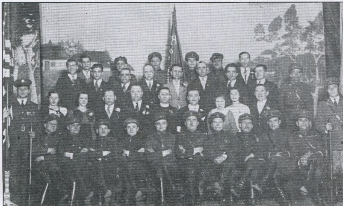
Управа і частина членів Товариства перед традиційною присягою нововибраного проводу 14 січня 1934 р.

Officers and some of the rank members of "Ch. Sitch" prior to the traditional swearing-in of the officers on January 14, 1934.