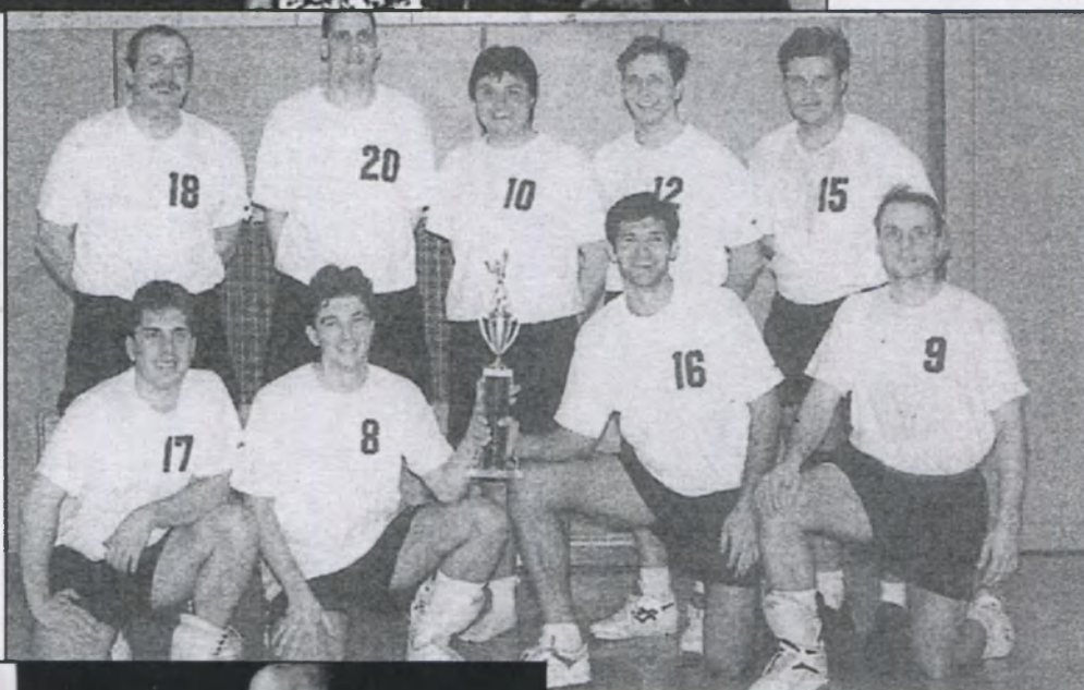
Men's volleyball team of "Ch. Sitch", champions in 5 tournament of the Volleyball Association of America in the "Garden Empire" region as well as the 1996 USCAK champions.