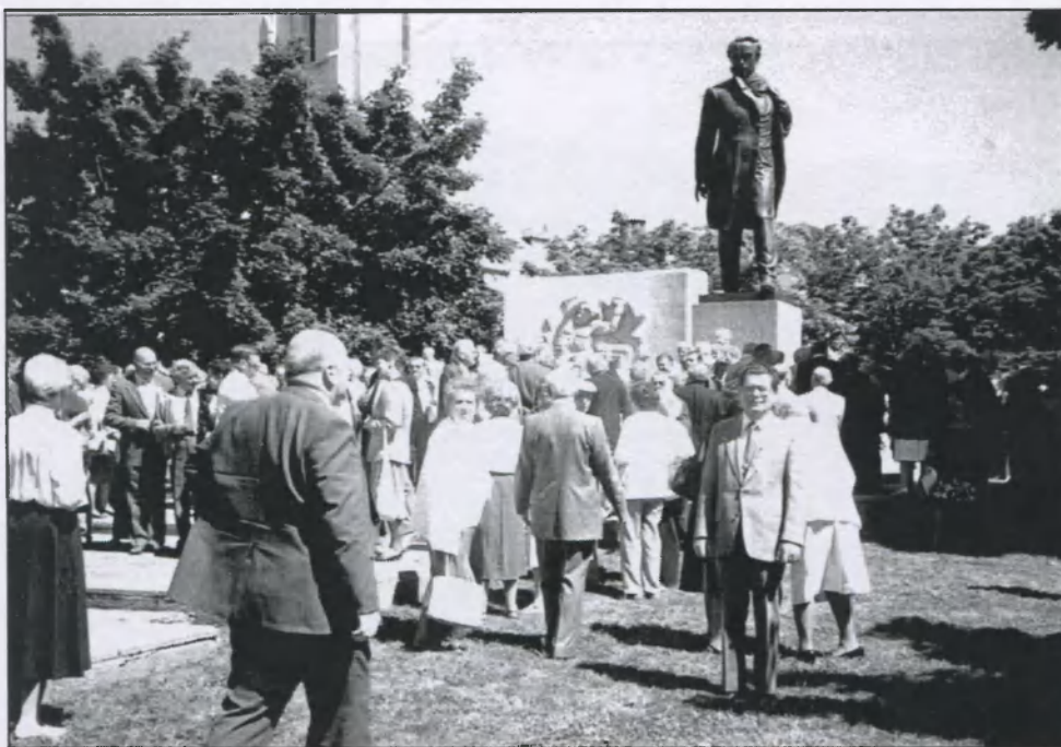
Члени Управи, симпатки і члени дружини копаного м'яча після змагань з Вашингтонським клубом відвідали пам'ятник Тарасові Шевченкові у Вашингтоні. 1967. The Chornomorska Sitch soccer team and members of the Executive Board following a scrimmage with a soccer club from Washington, the team visited the monument to Taras Shevchenko in Washington. 1967.