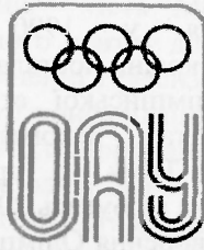
Рис.3.3. Емблема Олімпійської академії України