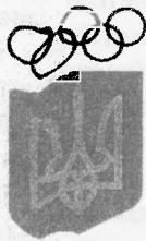
Рис.3.1. Емблема Національного олімпійського комітету України

Зауважимо, що ескізний проект емблеми НОК України, а також схему графічного зображення тризуба і олімпійських кілець виконали художники Ю. Савінов і Г. Федченко (деталь під") (рис.3.1). Нагадаємо, що згідно з правилом 35 Олімпійської хартії уся символіка НОКів потребує затвердження Виконкомом МОК. Емблему НОК України було затверджено 15 червня 1992 року.