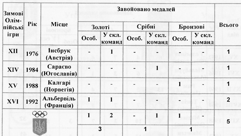
Таблиця Б.2. Результативність виступів спортсменів України на зимових Олімпійських іграх (1952 – 1992 рр.)*

*Україна Олімпійська (Olympic Ukraine): Ігри XXVII Олімпіади – Сідней 2000./ за ред. І.Н. Федоренка. – Київ: Аванті, 2000. – 176 с.