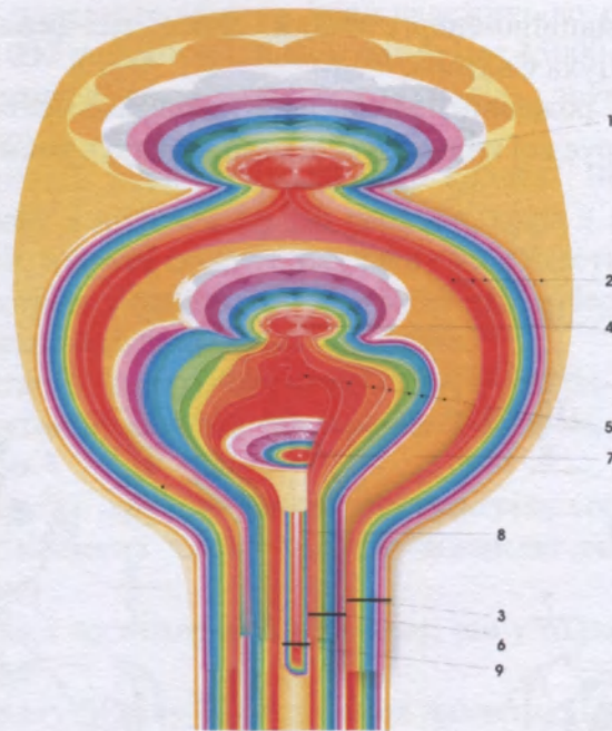
Мал. 2. Триїди духовних чакр:

1 – магатма – чакра Бога; 2 – інформаційно-енергетичні мікроканали чакри Бога охоплюють сахасрару і камешвара-камешвари чакри; 3 – магатмово-сушумновий сегмент; 4 – сахасрара – чакра Духа Святого; 5 – інформаційно-енергетичні мікроканали сахасрари чакри охоплюють камешвара-камешвари чакру; 6 – сахасрарово-сушумновий сегмент; 7 – камешвара-камешвари – чакра Ісуса Христа; 8 – інформаційно-енергетичні мікроканали камешвара-камешвари чакри; 9 – камешвара-камешварово-сушумновий сегмент.