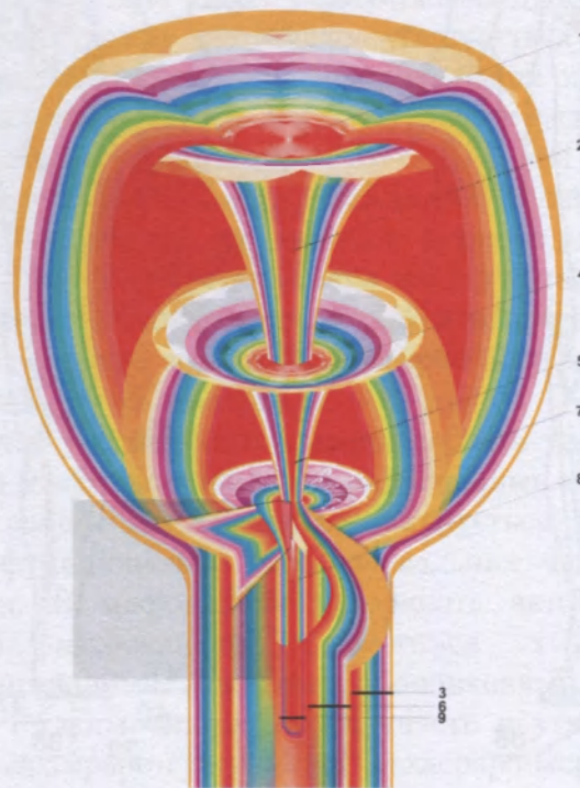
Мал. 3. Універсальна структуризація триїди духовних чакр:

1 – магатма – чакра Бога; 2 – інформаційно-енергетичні мікроканали чакри Бога охоплюють сахасрару і камешвара-камешвари чакри; 3 – магатмово-сушумновий сегмент; 4 – сахасрара – чакра Духа Святого; 5 – інформаційно-енергетичні мікроканали сахасрари чакри охоплюють камешвара-камешвари чакру; 6 – сахасрарово-сушумновий сегмент; 7 – камешвара-камешвари – чакра Ісуса Христа; 8 – інформаційно-енергетичні мікроканали камешвара-камешвари чакри; 9 – камешвара-камешварово-сушумновий сегмент.