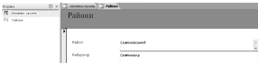
Рис. 3. Фрагмент бази даних «Райони Полтавщини»

Висновки. Розглянуто проблеми інформаційного забезпечення спортивно-оздоровчого туризму та активної рекреації Полтавської області.