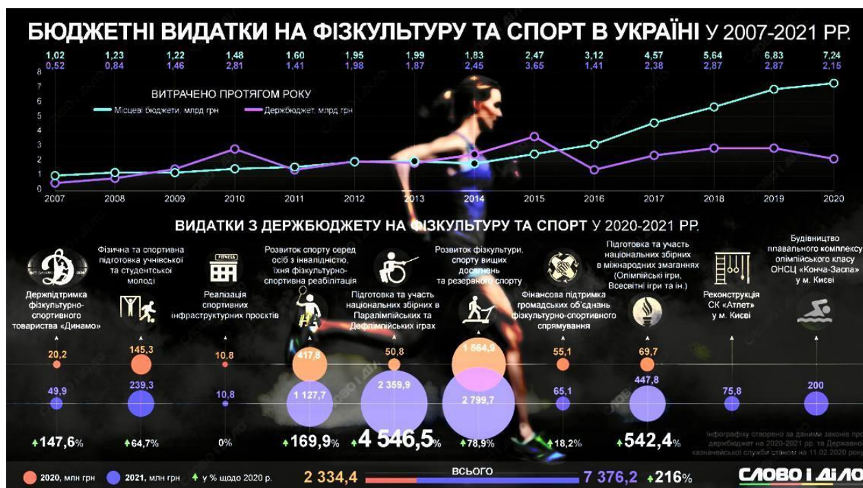
Рис. 1. Видатки на спорт і фізкультуру в Україні у 2007 – 2021 роках

Відповідно, як і торік, найбільшу частину виділеної суми – 4,2 млрд грн – спрямували на розвиток фізичної культури, спорту вищих досягнень і резервного спорту. Торік показник становив 2,5 млрд грн. Сюди не входять кошти на підготовку й участь у літніх Олімпійських іграх – 2024 та зимових юнацьких Олімпійських іграх – 2024. На це держава додатково виділила 777 млн грн. Так само окремо профінансовано підготовку й участь у Паралімпійських і Дефлімпійських іграх: це 1,9 млрд грн і це друга за розміром видатків стаття.