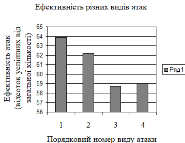
Рис. 1. Загальна кількість за гру (ліворуч) й успішність (праворуч) атак різного виду кваліфікованої команди з мініфутболу у відсотках (середні дані): 1 – загальна кількість атак; 2 – швидкі атаки; 3 – атаки зі стандартних положень; 4 – позиційні атаки

У табл. 2, у яку для якісного й кількісного порівняння зведено усереднені показники техніко-тактичних дій у змагальних умовах кваліфікованих дорослих і молодіжних команд з мініфутболу, додатково введено результати юніорської команди «BLACKSEAPSV