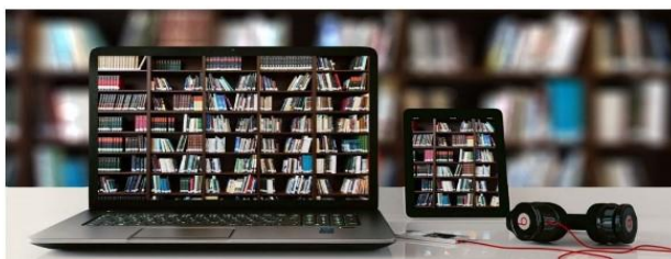
ПРО НАЦІОНАЛЬНИЙ РЕПОЗИТАРІЙ