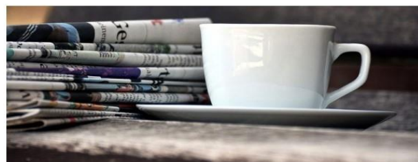
УСІ НОВИНИ НА ПОРТАЛІ