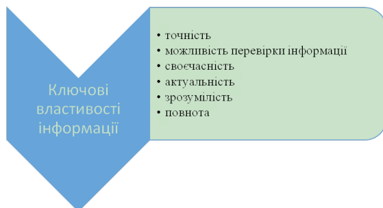
Рис. 2. Ключові властивості інформації