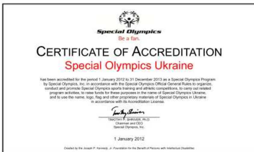
Рис. 2. Сертифікат акредитації ВГОІ «Спеціальна Олімпіада України»

«Акредитаційна ліцензія» – документ, що представляється кожною програмою як частина заявки на нову чи оновлену акредитацію, в разі затвердження Міжнародною організацією Спеціальних Олімпіад є підтвердженням повноважень програми та підставою для видачі сертифікату акредитації (рис.2).