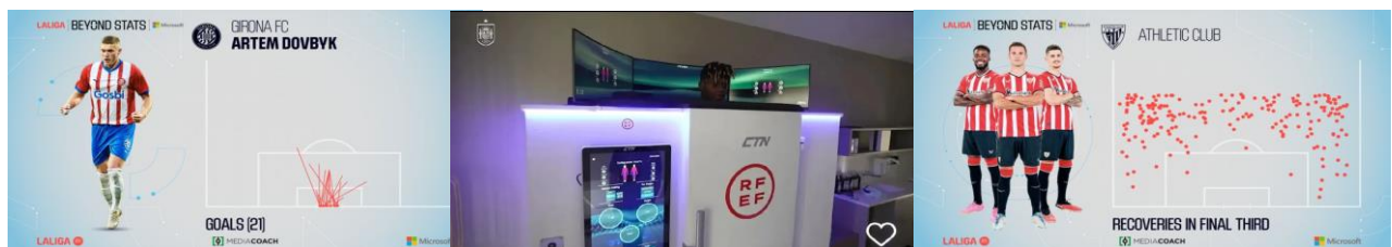
Рис. 3. Використання аналізу ігрових даних для оцінки продуктивності гравців, виявлення слабких місць та удосконалення тактико-стратегічних аспектів командної гри як ефективна система комплексного контролю гравців та взаємодії зі світовими технологічними гігантами (у даному випадку – це Microsoft) у чемпіонаті Іспанії

3. Аналіз даних: фахівці тренерських штабів професійних футбольних клубів Іспанії використовують аналіз ігрових даних для оцінки продуктивності гравців, виявлення слабких місць та удосконалення тактико-стратегічних аспектів командної гри (рис. 3).