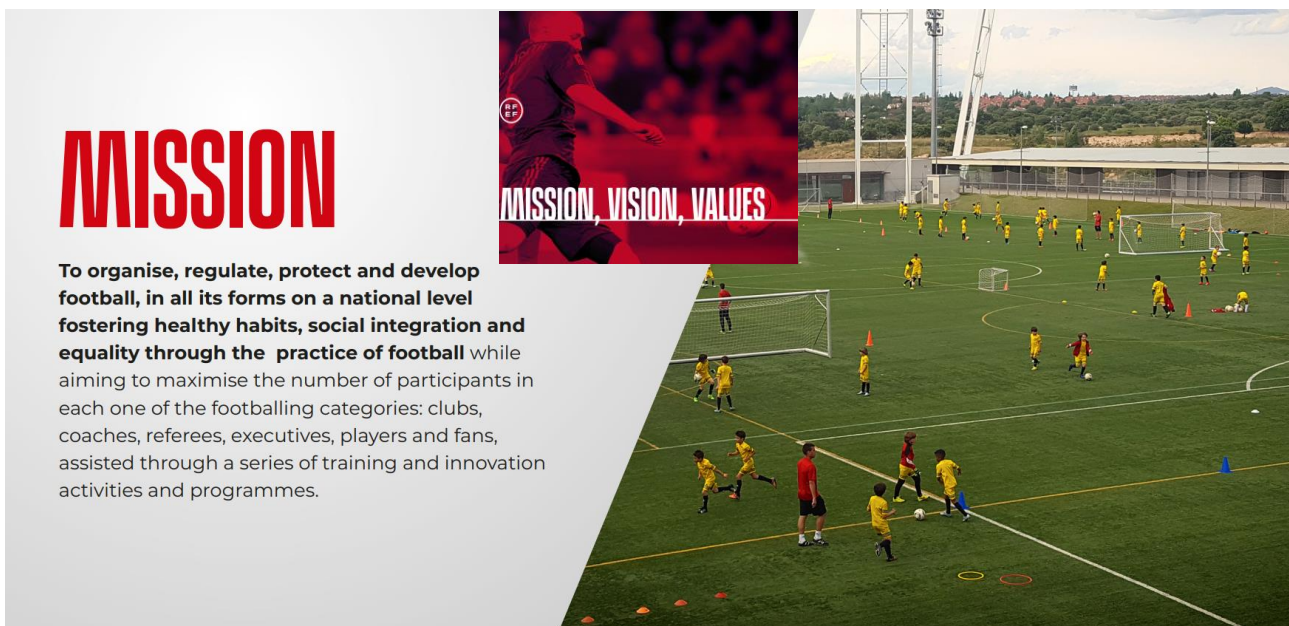
Рис. 1. Теоретико-методичне формулювання основної місії іспанського футболу у сучасному європейському футбольному співтоваристві (за даними офіційного сайту Королівської іспанської федерації (RFEF) – режим доступу: https://rfe.es/es )

Виклад основного матеріалу дослідження. Офіційний сайт Королівської іспанської федерації футболу (іспанською - Real Federación Española de Fútbol (RFEF)) формулює основну місію іспанського футболу у сучасному європейському футбольному співтоваристві таким чином (рис. 1):