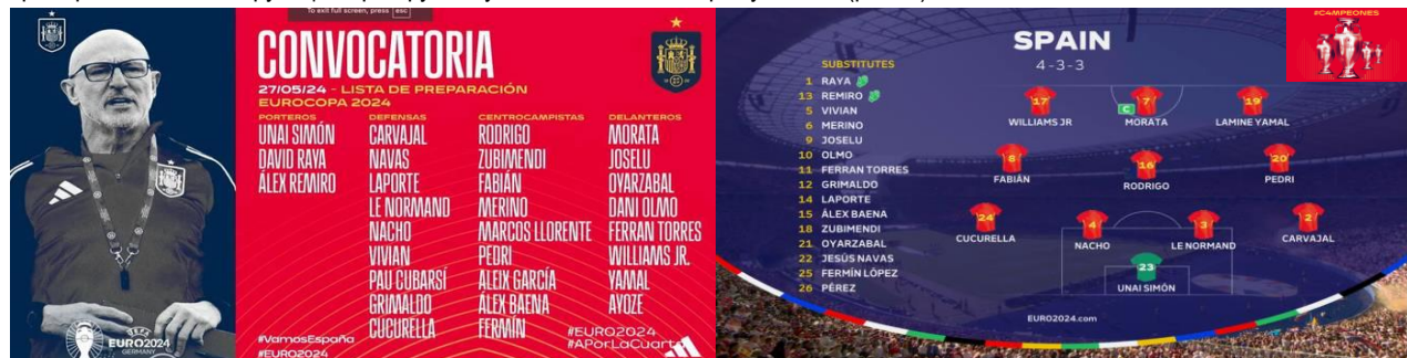
Рис. 5. Основні гравці й ігрова тактико-стратегічна схема організації та побудови змагальної діяльності національної збірної команди Іспанії головним тренером Луїсом Де ла Фуенте на чемпіонаті Європи з футболу 2024 року

Такі технології сприяють розвитку іспанського футболу та підвищують якість гри футболістів у професійних футбольних клубах і національних збірних Іспанії. Свідченням цьому є заслужена перемога національної збірної Іспанії на чемпіонаті Європи з футболу 2024 року, який проходив у період з 14 червня до 14 липня 2024 року на футбольних полях Німеччини. Більшість гравців і тактико-стратегічні схеми організації та побудови гри головним тренером національної збірної Іспанії Луїсом Де ла Фуенте на чемпіонаті Європи з футболу 2024 року – це продумана до найменших деталей система [16, 18], виплекана багаторічною працею багатьох поколінь іспанських тренерів, гравців, селекціонерів, фахівців тренерських штабів, функціонерів футболу, а також всього народу Іспанії (рис. 5).