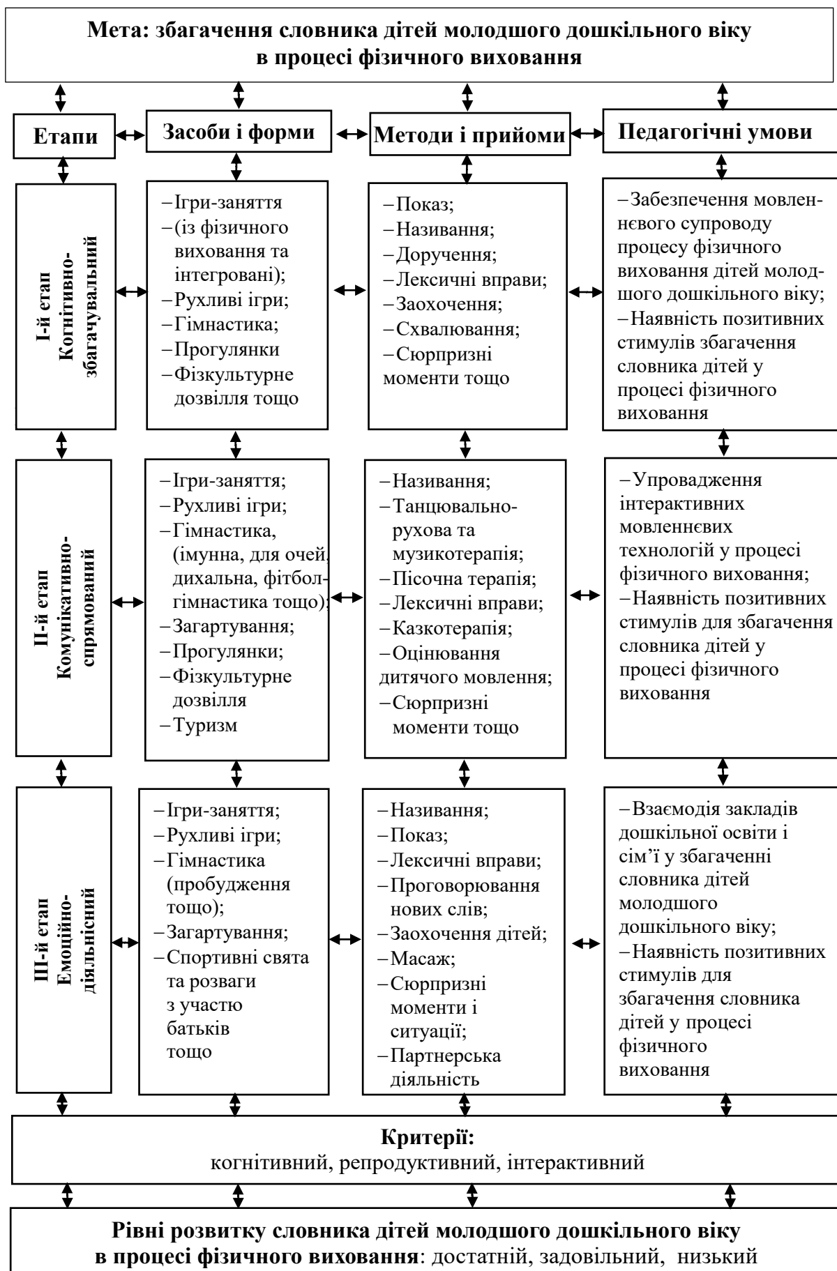
Рис. 2.1. Модель збагачення словника дітей молодшого дошкільного віку в процесі фізичного виховання