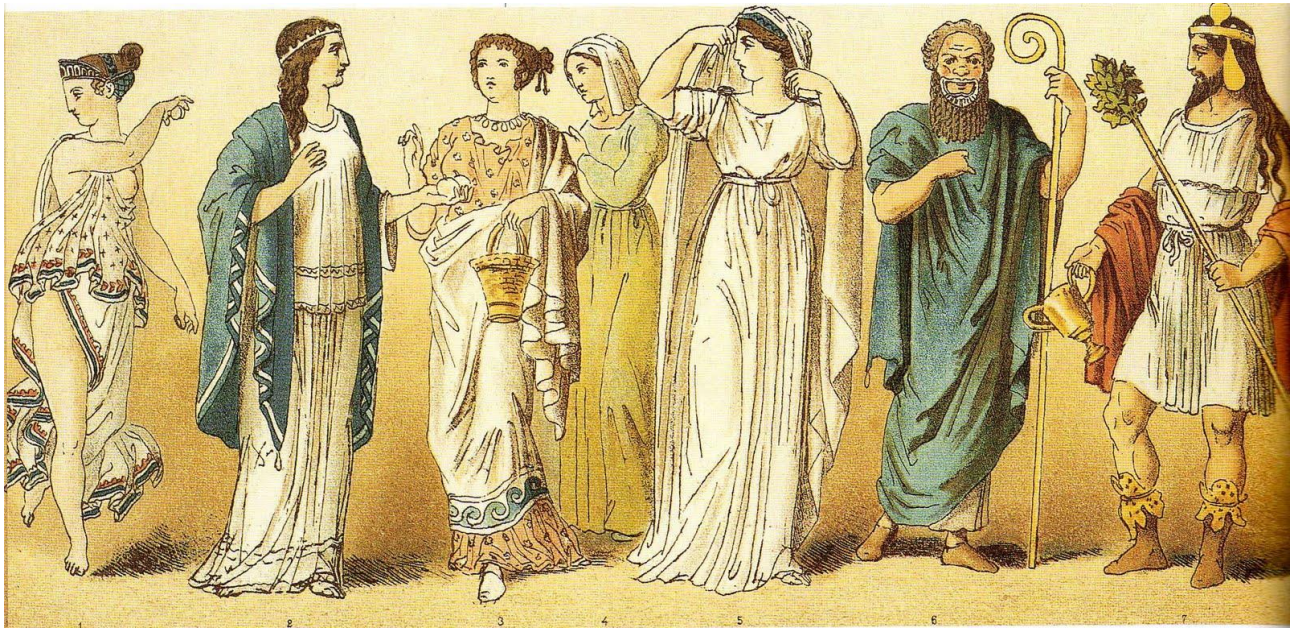
Рис. 2. Сценічне мистецтво в Стародавній Греції

Тут професія актора була дуже популярна. Кожен прославлений полководець, вважав своїм обов'язком мати при собі штат акторів, які крім іншого навчали його ораторському мистецтву. Імена хороших акторів були відомі всьому місту, і глядачам часто не вистачало місць на спектаклях.