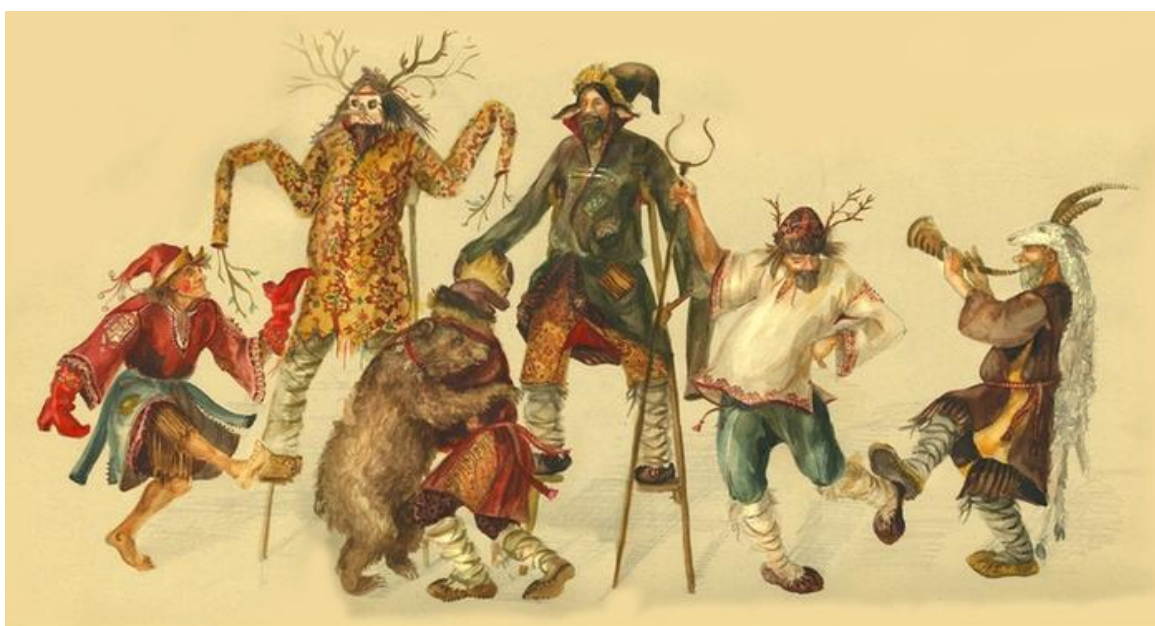
Рис. 3. Скоморохи