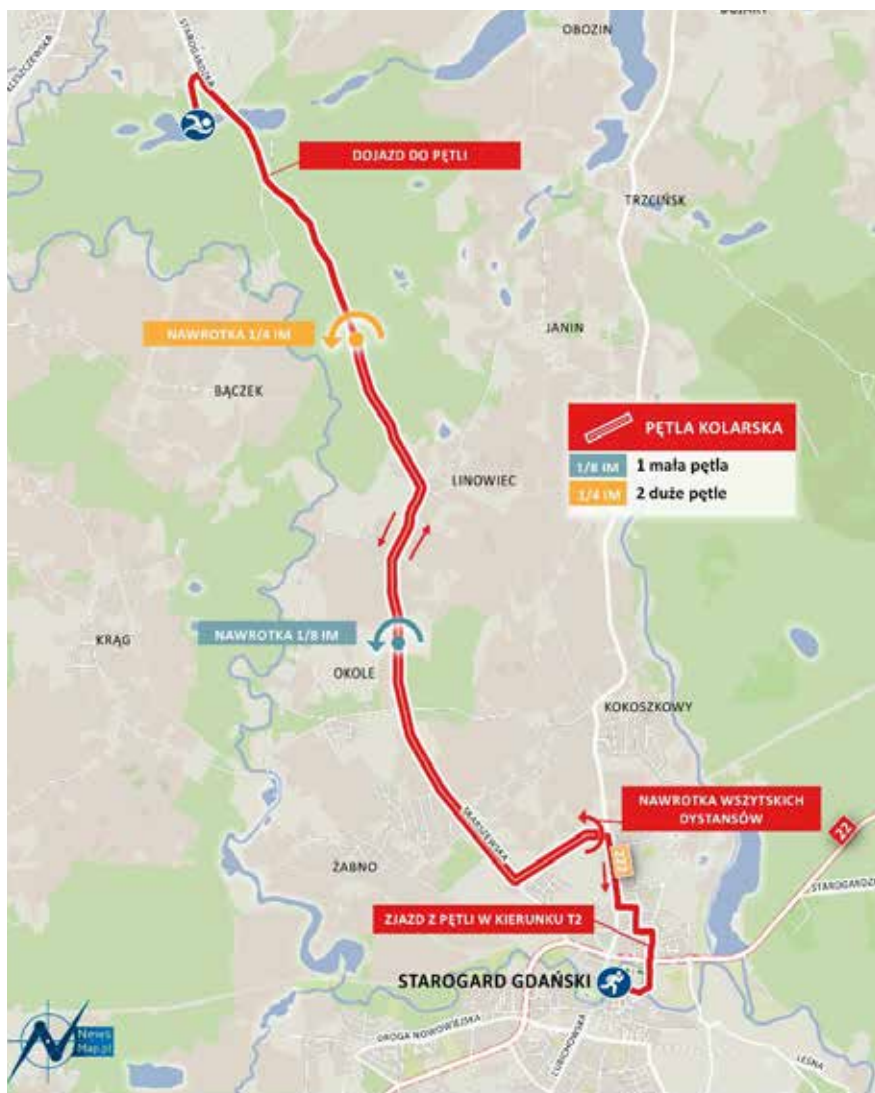
Рис. 4. Траса другого (велосипедного) етапу триатлону