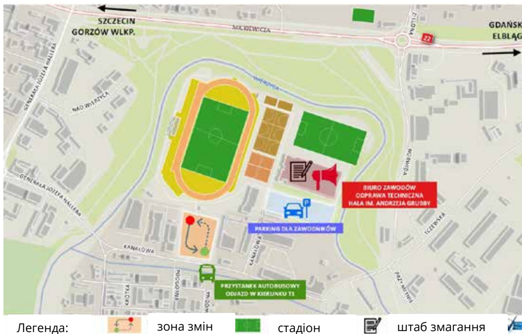
Рис. 2. Ситуаційний план триатлону «Polpharma Triathlon Energy»

Традиційні змагання з триатлону під назвою «Polpharma Triathlon Energy» проводять у Старогарді-Гданському від 19 червня 2016 року. Їх ініціатором став олімпійський чемпіон із веслування Адам Король. Метою проведення цих змагань була пропаганда здорового способу життя та популяризація міста. Учасники починали змагання з плавання в акваторії Плачевського озера, далі пересідали на велосипеди і долали дистанцію 45 км. Завершував змагання забіг на 10,55 км із фінішем на Муніципальному стадіоні імені Казімежа Дейни у Старогарді-Гданському (рис. 2-5).