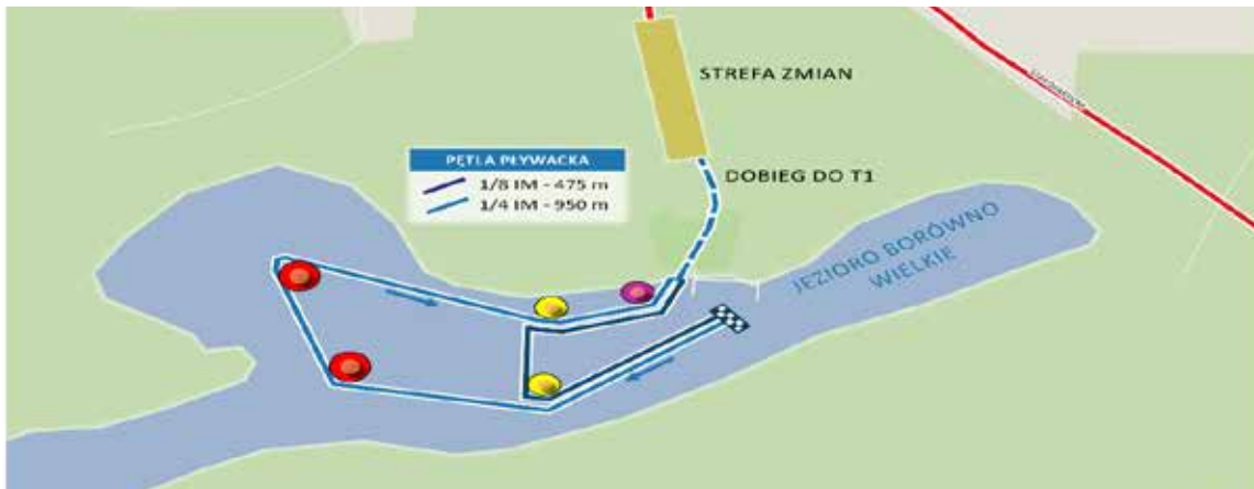
Рис. 3. Траса першого етапу (плавання) триатлону