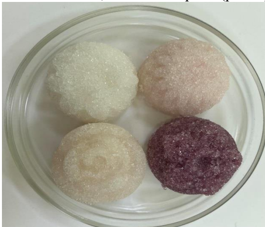
Рис. 1. Збагачений цукор похідними дикорослих ягід

Результати. Нами розроблена технологія отримання цукру з похідними дикорослої сировини [5] ягід Viburnum opulus , Sambucus nigra , Pyrrophae rhamnoides L., Sorbus aucuparia (рис. 1).