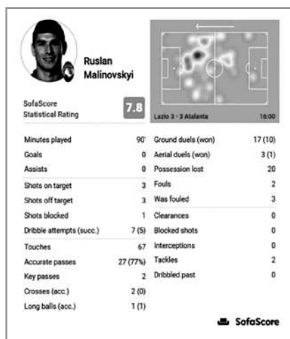
Рис. 3. Теплова карта ігрової діяльності центрального атакувального півзахисника-плеймейкера Руслана Малиновського в матчі чемпіонату Італії з «Лацио» (Рим)

високому рівні лише як гравець цього амплу, то О. Зінченко тільки в національній збірній України є гравцем центральної ланки ігрових «плеймейкерів». У клубах «Манчестер Сіті» (Манчестер, Англія) та «Арсенал» (Лондон, Англія), в якому на теперішній час виступає Олександр Зінченко, тренерський штаб задіює гравця національної збірної України на позиції лівого флангового захисника або «латераля», використовуючи навички гри півзахисника української національної збірної у центральній зоні футбольного поля (рис. 3, 4).