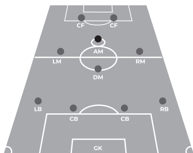
Рис. 1. Умовне розміщення центрального атакуючого півзахисника-плеймэйкера (AM) в тактико-стратегічних положеннях футбольної команди

Результати дослідження та їх обговорення. Плеймэйкер, умовне тактичне розташування якого на футбольному полі зобра-