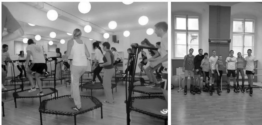
Рис. 2 Участь у різних фітнес-програмах

– беруть участь у різних видах рухової активності (катання на гірських лижах і ковзанах, болдринг, аквааеробіка, боулінг) (рис. 3);