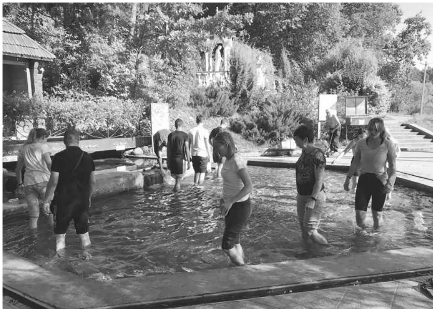
Рис. 4. Джерело «Раковець»

– знайомляться із рекреаційно-оздоровчими ресурсами Львівщини (ландшафтний парк «Знесіння», джерело «Раковець» та ін.) (рис. 4).