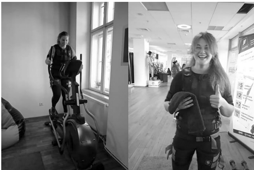
Рис. 1 Участь у різних фітнес-програмах