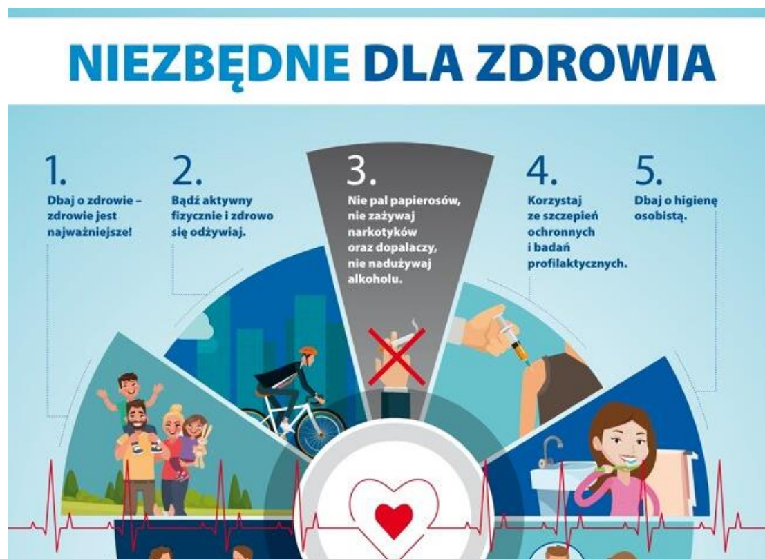
Ryc. 1. Niezbędne dla zdrowia elementy życia